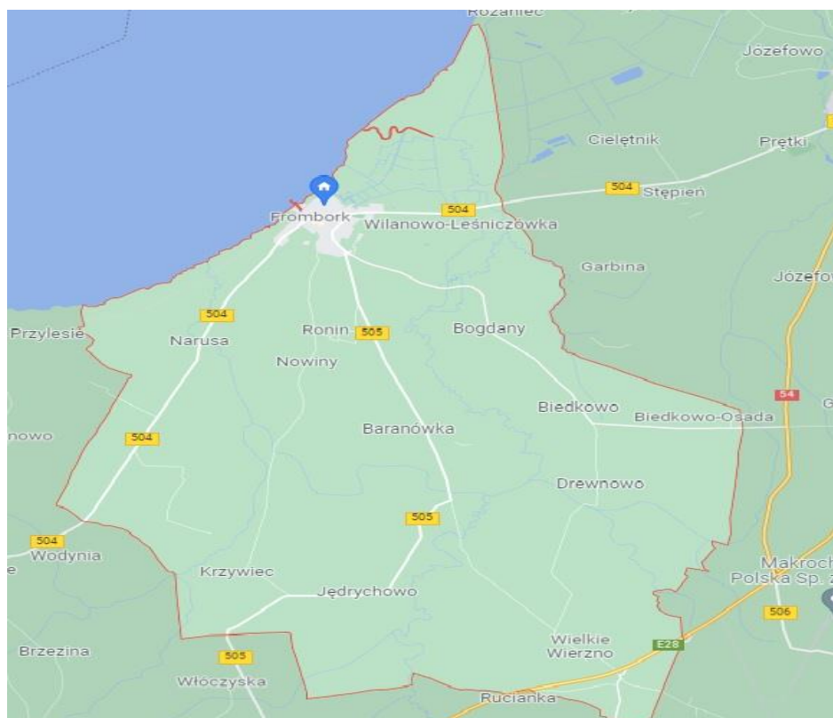
Rysunek 1 Teren administracyjny Miasta i gminy Frombork